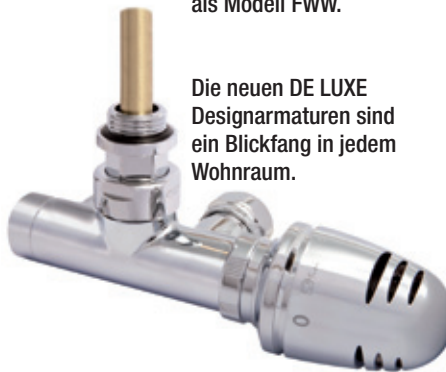
Die neuen DE LUXE Designarmaturen sind ein Blickfang in jedem Wohnraum.

Die neue HERZ Regelstation Compactfloor als Modell FWW entspricht u.a. auch einem dieser vorgegebenen Module. Der Stangenverteiler ist aus Messing und der Plattenwärmetauscher für die Systemtrennung aus Edelstahl in Kupfer gelöteter Ausführung. Die Flächenheizkreise sind individuell auf die jeweilig erforderliche Wassermenge mittels Flowmetern einstellbar. Ebenso sind ein Ausdehnungsgefäß und eine Sicherheitsgruppe bereits werkseitig vorinstalliert.